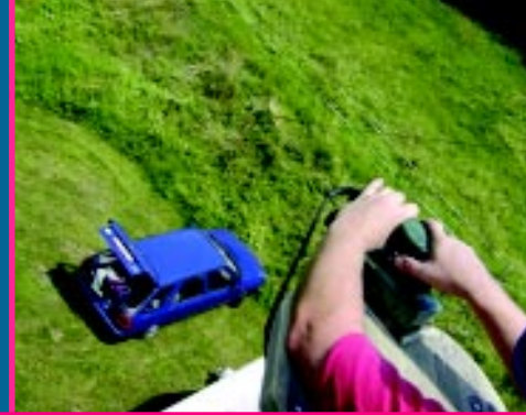
Montage in großer Höhe ...