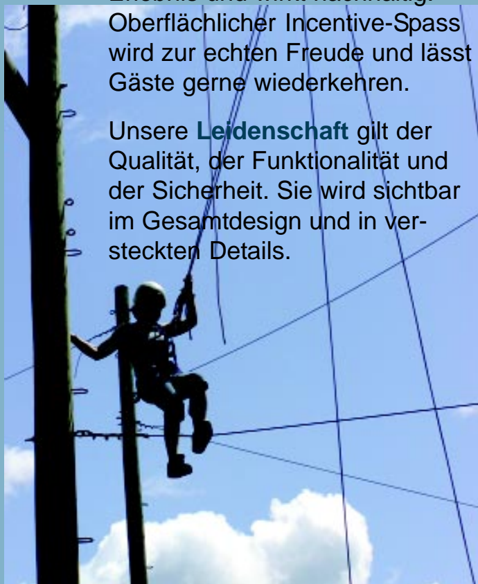
Doppelt sicher in acht Meter Höhe: „Multivine Traverse“

Unsere Leidenschaft gilt der Qualität, der Funktionalität und der Sicherheit. Sie wird sichtbar im Gesamtdesign und in versteckten Details.