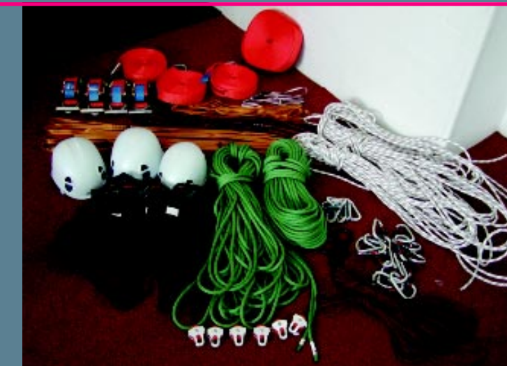
Tools für Trainer: praxiserprobt, normengerecht, vielseitig ...

Material-Sets für Trainer: Durchdachte Seil-Sets für den raschen Bau von mobilen Elementen und innovative Materialien für Problemlösungs-, Initiativ- und Kooperationsaufgaben.