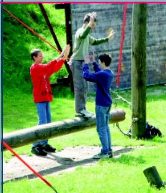
Training von „Social Skills“ für junge Mitarbeiter: „Swing Beam“

Mit einem Seilgarten bekommen Hotels, Schulen, Kliniken, Jugend- und Gesundheitszentren ein attraktives Profil. Sie haben damit ein herausragendes Angebot für Ihre Zielgruppe.