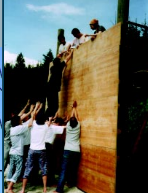
Herausforderung für das Team: „The Wall“